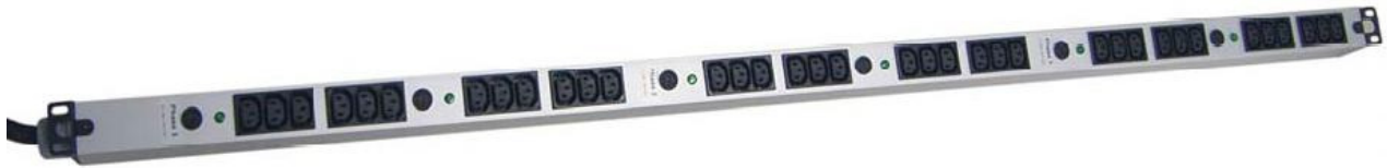
Immagine del modello